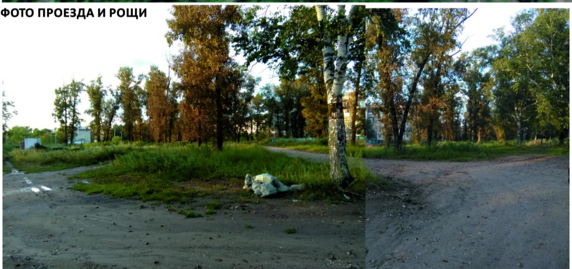
ФОТО ПРОЕЗДА И РОЩИ