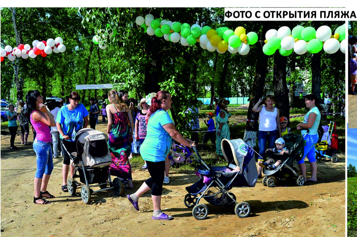
ФОТО С ОТКРЫТИЯ ПЛЯЖА 2013 ГОД