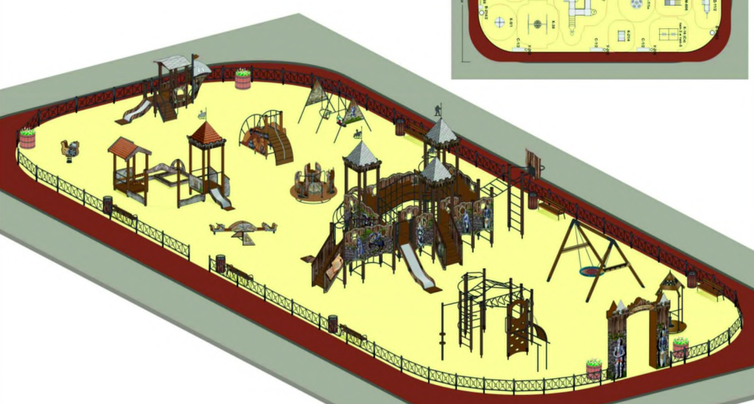
16 ДЕТСКАЯ ПЛОЩАДКА 19/41 М С ПОКРЫТИЕМ ИЗ РЕЧНОГО ПЕСКА (СМ. ЛИСТ 2) НА ТЕРРИТОРИИ МНОГОКВ. ДОМА ДОК-21