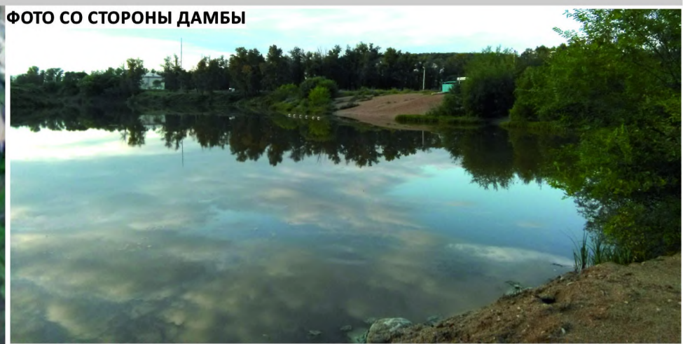
ФОТО СО СТОРОНЫ ДАМБЫ