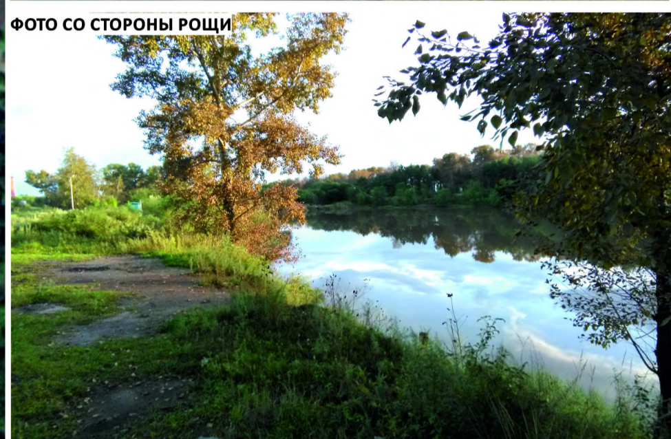
ФОТО СО СТОРОНЫ РОЩИ