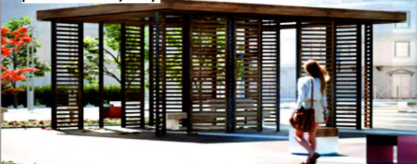
1 ПЛОЩАДКА ДЛЯ ОТДЫХА С БЕСЕДКОЙ И ЛАВОЧКАМИ (РАЗМЕРОМ 3/3 М)