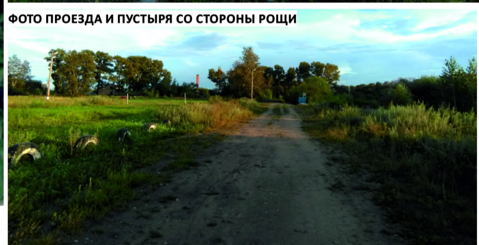
ФОТО ПРОЕЗДА И ПУСТЫРЯ СО СТОРОНЫ РОЩИ