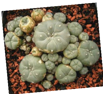
кактус, содержащий мескалин