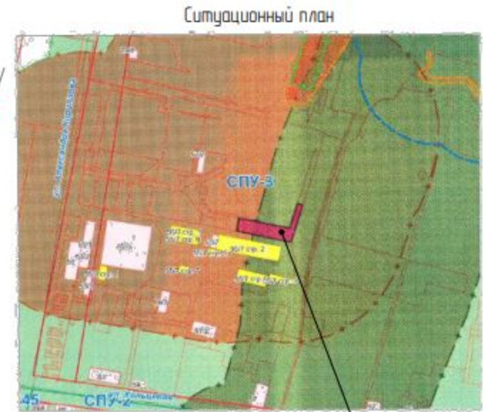
Участок строительства с кадастровым номером 28.01.020015.537

Охранная зона объектов электросетевого хозяйства