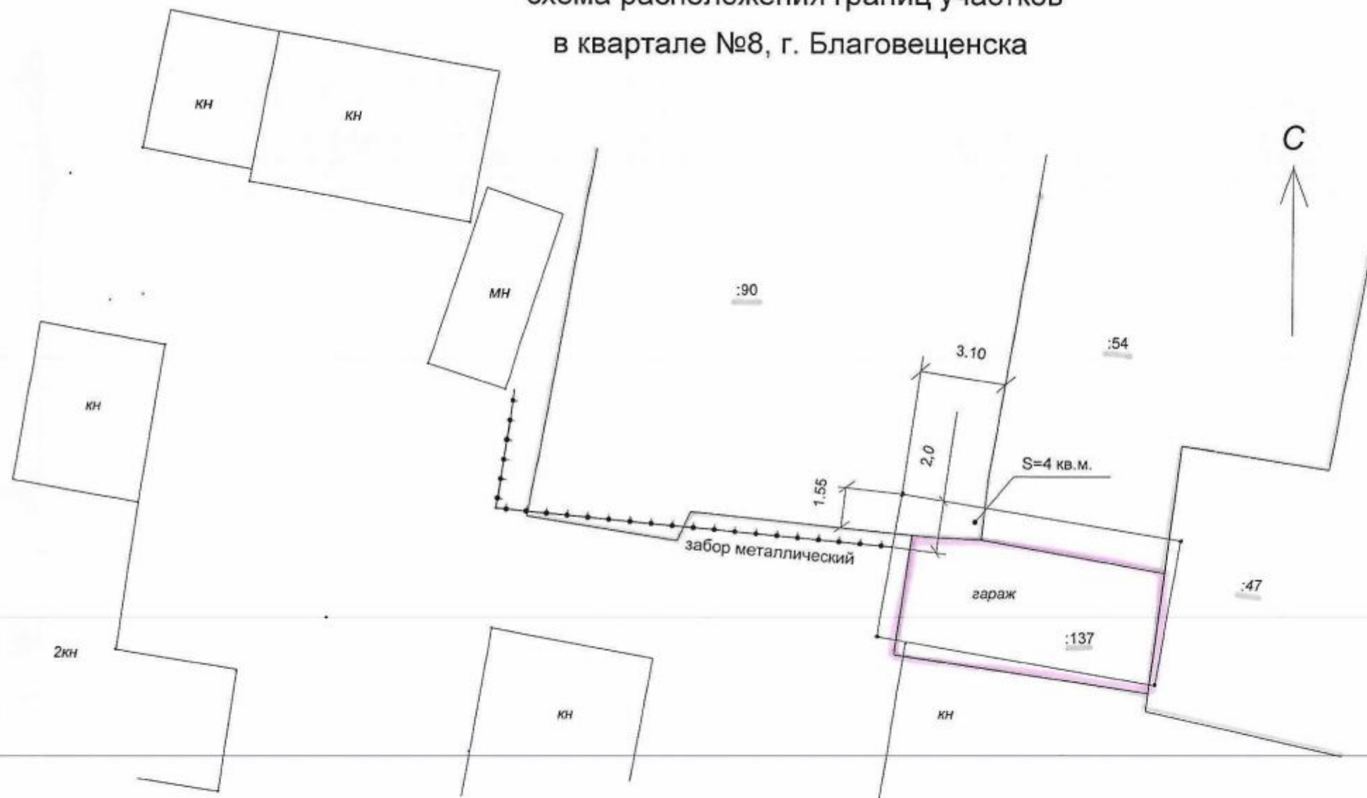
схема расположения границ участков в квартале №8, г. Благовещенска