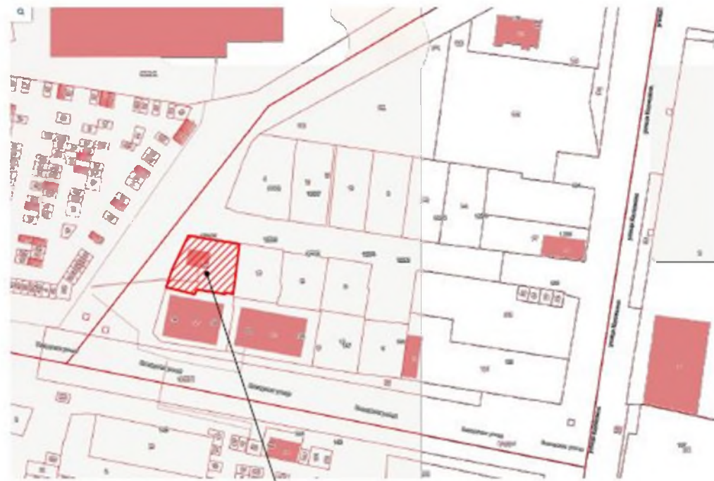
Участок строительства с кадастровым номером 28 01 01027115