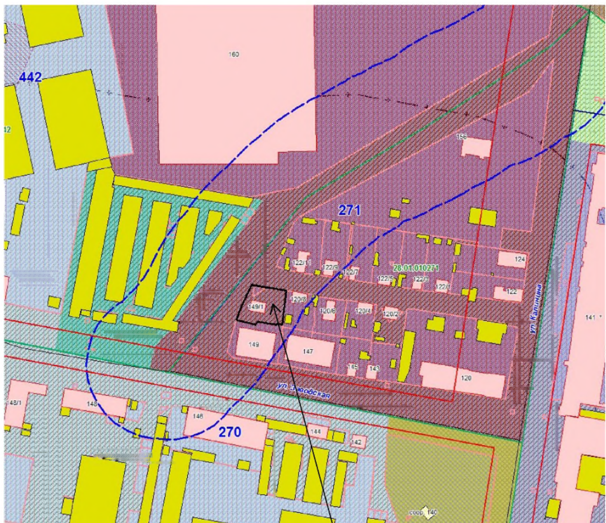
земельный участок с кадастровым номером 28:01:010271:15

к проекту постановления администрации города Благовещенска «О предоставлении разрешения на условно разрешенный вид использования земельного участка с кадастровым номером 28:01:010271:15 и объекта капитального строительства с кадастровым номером 28:01:010271:131, расположенных в квартале 271 города Благовещенска»