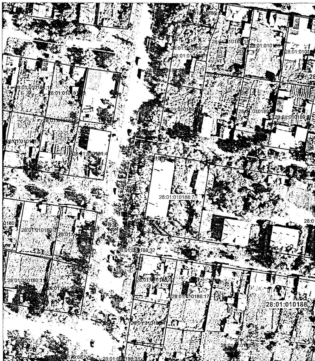
Схема расположения публичного сервитута для размещения сетей ВОДООТВЕДЕНИЯ