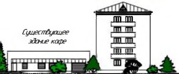
Существующее здание кафе