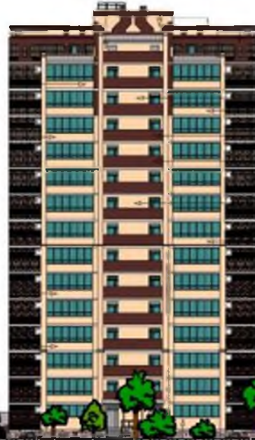
Проектируемый многоквартирный жилой дом