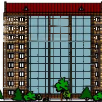
Строящийся многоквартирный жилой дом