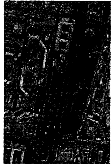
граница проектирования кадастровый квартал